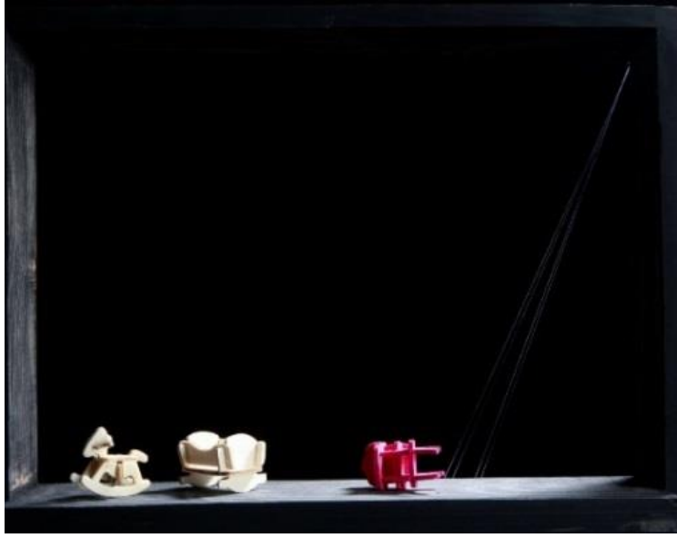
Hanife Neris Yüksel, N11, Karışık Malzeme, 40cmx30cmx10cm, 2019